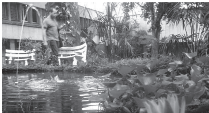
Instalaciones de la Escuela de Ingeniería Sanitaria (Eidenaar)

El Programa Académico de Ingeniería Sanitaria recibió la acreditación como Programa Académico de Alta Calidad del Ministerio de Educación Nacional por un período de 9 años, en el 2002. También ha recibido distinciones al talento de sus egresados por organizaciones como la Asociación Interamericana de Ingeniería Sanitaria y Ambiental -AIDIS, y la ubicación de los estudiantes en los más altos estándares de los exámenes de Calidad de la Educación Superior Saber Pro, antes ECAES.