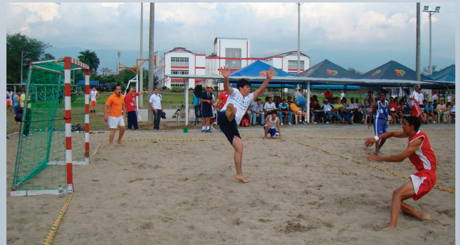
Selección Colombia de balonmano entrenando en la Sede Palmira.

Las Selección Colombia, masculina y femenina, de Balonmano Playa que participará en los II Juegos Suramericanos de Playa, en Manta-Ecuador, están instalados para su preparación en la Sede Palmira de la Universidad del Valle.