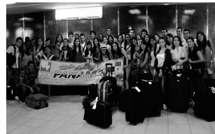
Estudiantes participantes de la 'Misión Panamá'

Para brindar una perspectiva internacional a sus respectivos programas, la Facultad ha contratado durante el año 20 profesores visitantes internacionales en todos sus programas. Además, seis profesores están en comisión académica, optando al doctorado, en prestigiosas universidades de España, Holanda y Canadá.