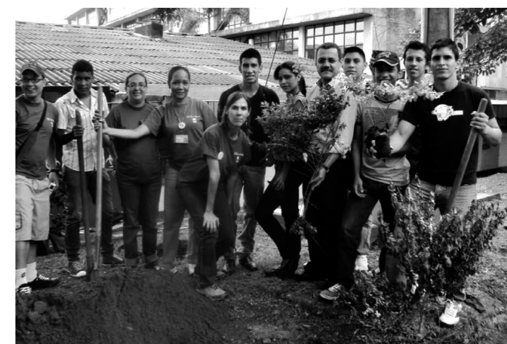
A.M.A Directivos de la Facultad en jornada de siembra de árboles.