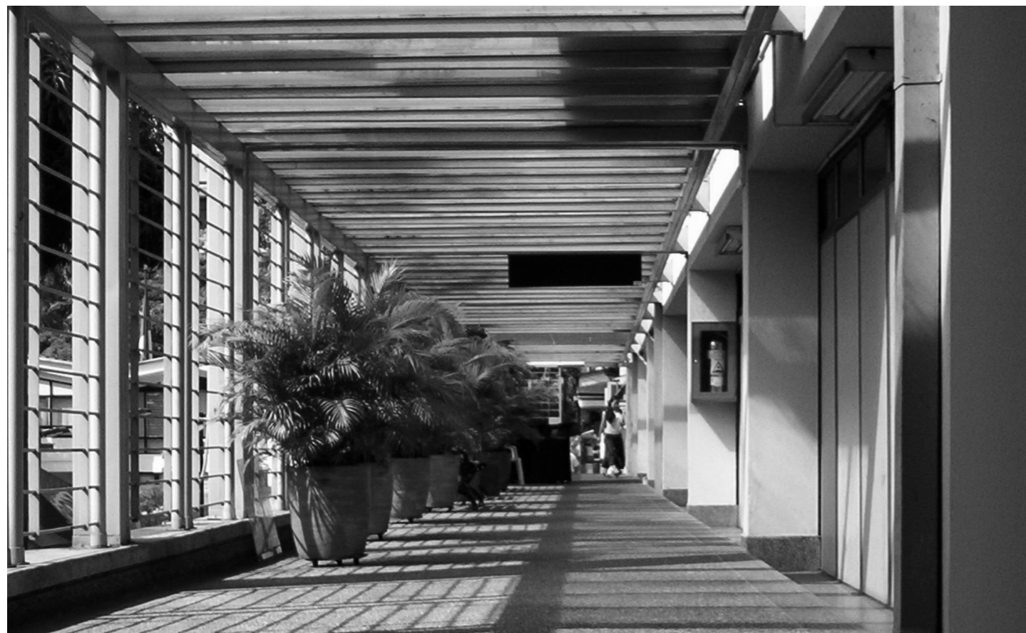
Pasillo del Edificio de la Facultad de Ciencias de la Administración.

Desde 1964, cuando en la Facultad de Ciencias de la Administración se fundó el primer posgrado de Colombia, ha demostrado una permanente actividad investigativa reflejada en una producción intelectual significativa. A través de la investigación, en la Facultad se plantean salidas creativas a problemas del entorno institucional y empresarial y se forman profesionales con experiencia y versatilidad para afrontarlos en ambientes laborales complejos y competitivos.