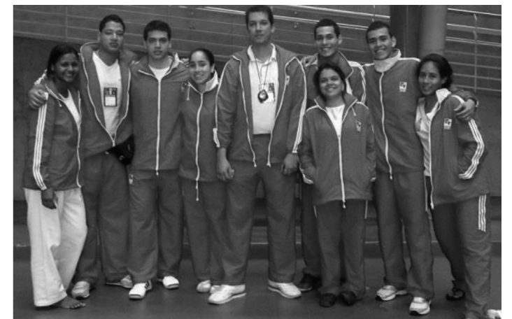
juegos: Equipo de Karate-Do de la Universidad del Valle que participó en los XX Juegos Nacionales Universitarios.

Los XX Juegos Nacionales Universitarios Medellín 2011 fueron organizados por Ascundeportes Colombia y Ascundeportes Antioquia, con el apoyo de Inder Medellín, Indeportes Antioquia y Fedelian. Los estu-