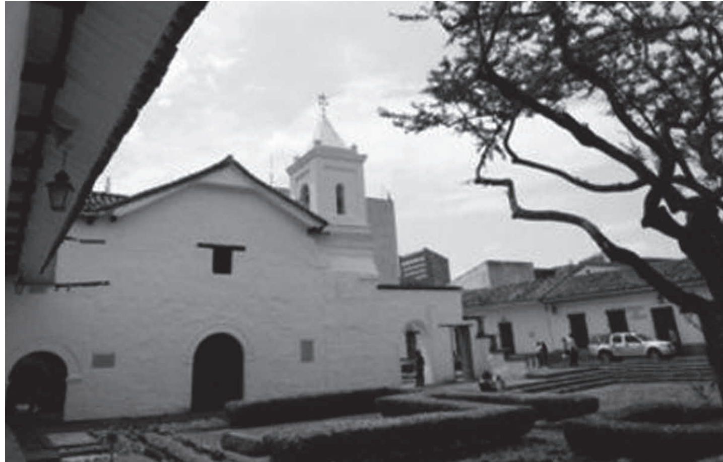
Museo de Arte Colonial y Religioso La Merced.

El Centro de Investigación Territorio, Construcción y Espacio –CITCE de la Escuela de Arquitectura de la Universidad del Valle será el encargado de proponer los estudios que integran el Plan Especial de Manejo y Protección –PEMP, para la restauración de la Hacienda Cañasgordas y la recuperación y protección del Centro Histórico de Santiago de Cali.